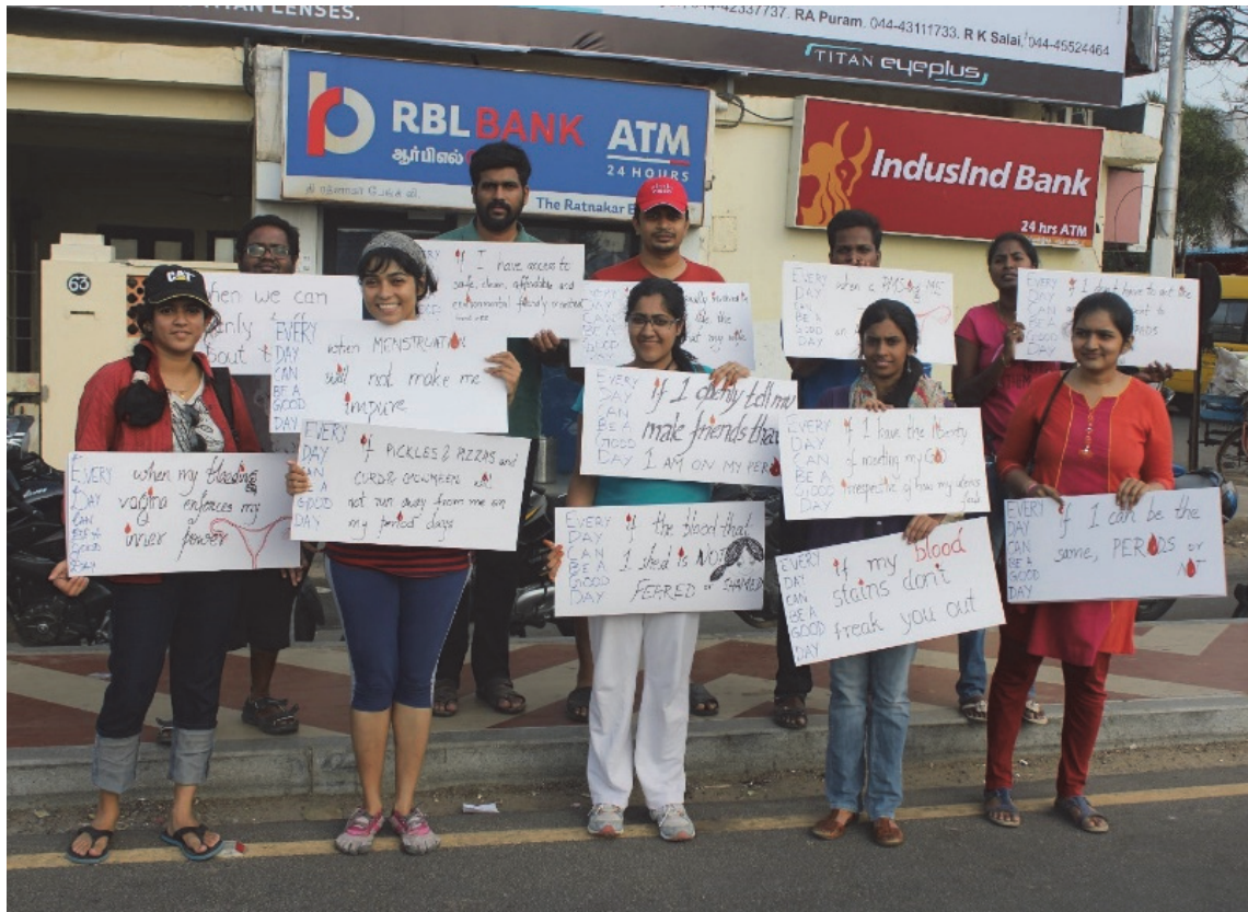
Manifestation en Inde pour réduire la stigmatisation et les tabous entourant la menstruation lors de la journée mondiale de l'hygiène menstruelle.

physiquement accessible et à un coût abordable, d'une eau salubre et de qualité acceptable pour les usages personnels et domestiques. Le droit humain à l'assainissement garanti à chacun, dans toutes les sphères de la vie, le droit à un assainissement accessible physiquement, de coût abordable, salubre, hygiénique, socialement et culturellement acceptable, et qui assure la protection de l'intimité de la personne et de sa dignité. 3