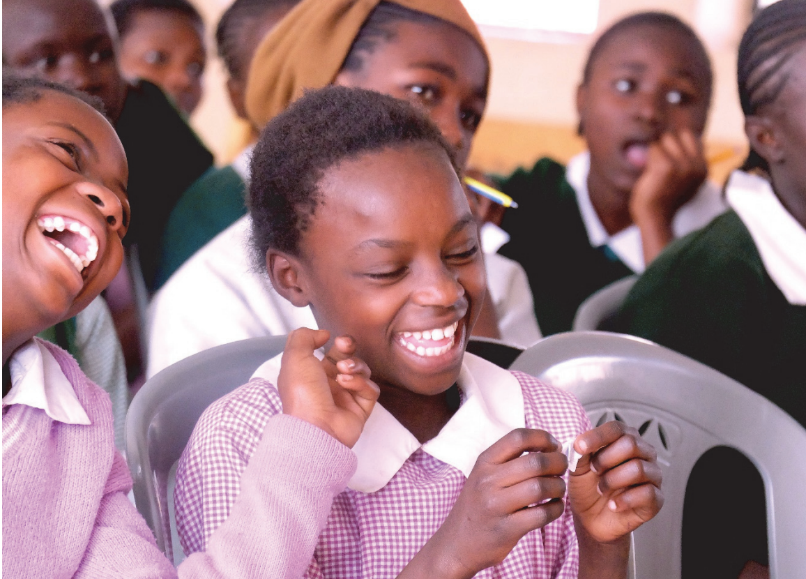
Des filles du Kenya en train de rire pendant une séance d'information sur la menstruation et l'hygiène menstruelle.

mettre en place des mesures et [...] encourager des comportements et des activités susceptibles de promouvoir un comportement sain en intégrant des thèmes pertinents dans les programmes scolaires » est particulièrement important dans le contexte de la santé et du développement des adolescents. 12 Les États parties à la Convention relative aux droits de l'enfant et à la Convention sur l'élimination de toutes les formes de discrimination à l'égard des femmes sont tenus de prendre toutes les mesures appropriées afin de réduire le taux d'abandon scolaire et d'éliminer la discrimination à l'égard des filles susceptible d'augmenter leur taux d'abandon scolaire.