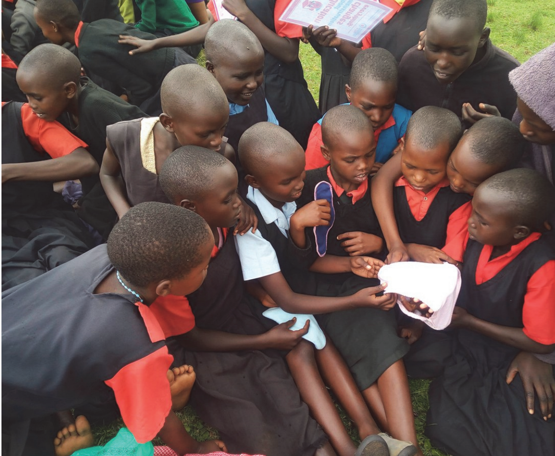
Des enfants du Kenya examinant une gamme de produits d'hygiène menstruelle lors d'un événement pour célébrer la journée mondiale de l'hygiène menstruelle, 2017.

Bien que davantage de recherches soient nécessaires, les études relevant du domaine WASH associent clairement les défis de la GHM en milieu scolaire à l'absentéisme 16 , qui peut finalement mener à l'abandon scolaire.