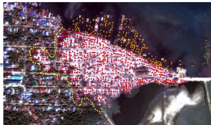
毁坏程度评估：人权观察