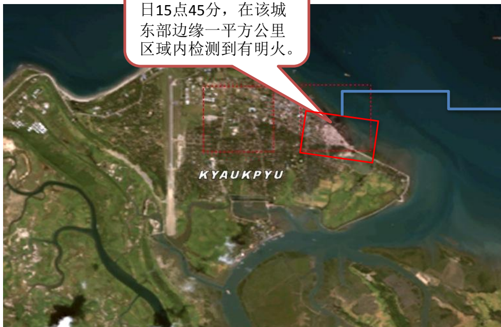
毁坏程度评估：人权观察

世界标准时间10月24日15点45分，在该城东部边缘一平方公里区域内检测到有明火。