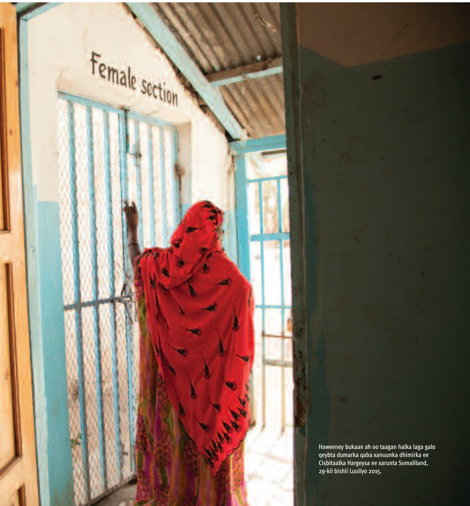
Haweeney bukaan ah oo taagan halka laga galo qeybta dumarka qaba xanuunka dhimirka ee Cisbitaalka Hargeysa ee xarunta Somaliland, 29-kii bishii Luuliyo 2015.